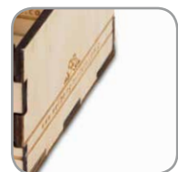
Miejsca na blok z karteczkami 85x85mm