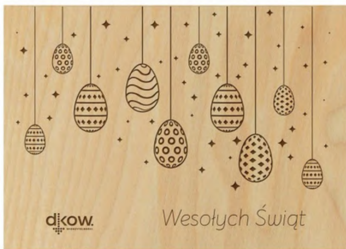
Kartka świąteczna - Wydmuszki ksd42 15 x 10,5 cm