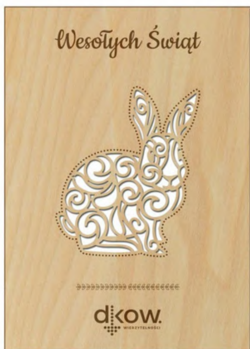
Kartka wielkanocna - Zając ksd44 15 x 10,5 cm